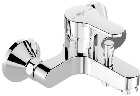
Plus Einhebel-Badearmatur AP DN15