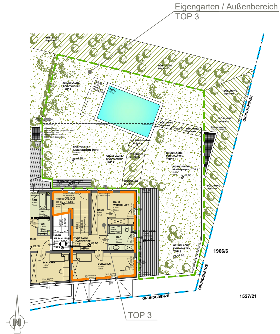
OBERGESCHOSS TOP 3, Eigengarten M 1:200