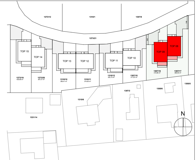
LAGEPLAN M 1:100