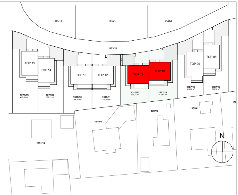
LAGEPLAN M 1:1000