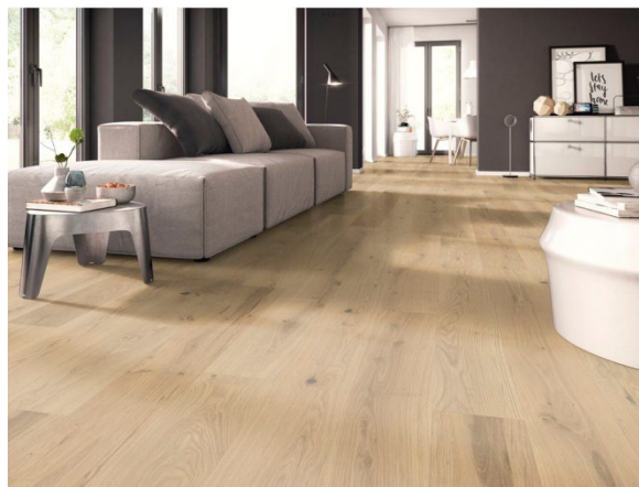
Landhausdiele Eiche kraftvoll, weiß geölt