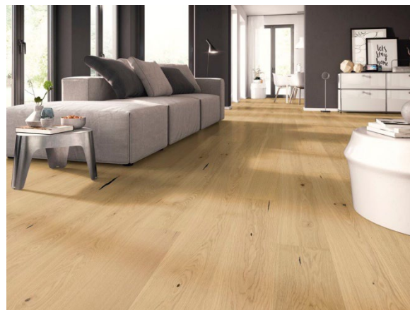
Landhausdiele Eiche kraftvoll, natur geölt