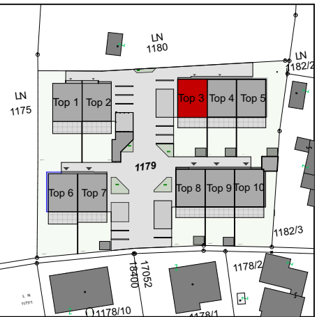
Lageplan M: 1:1500